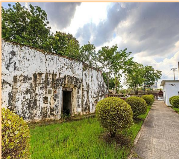
ทางเดินชมค้ำควแม่ไก่