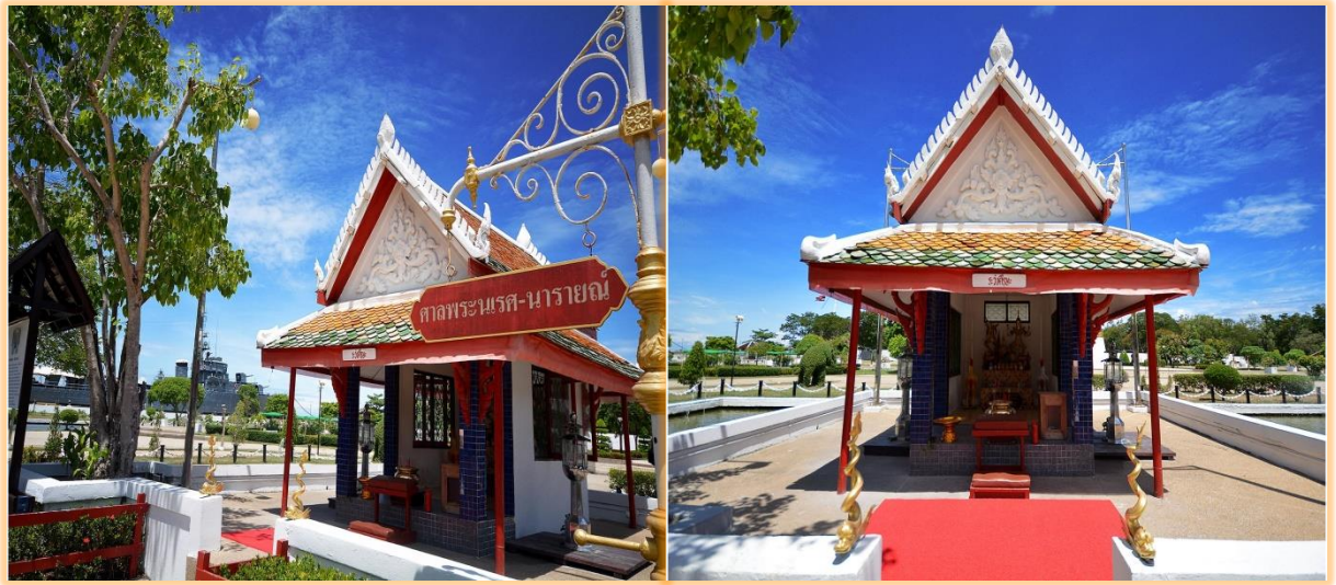
ศาลพระนเรศ – นารายณ์