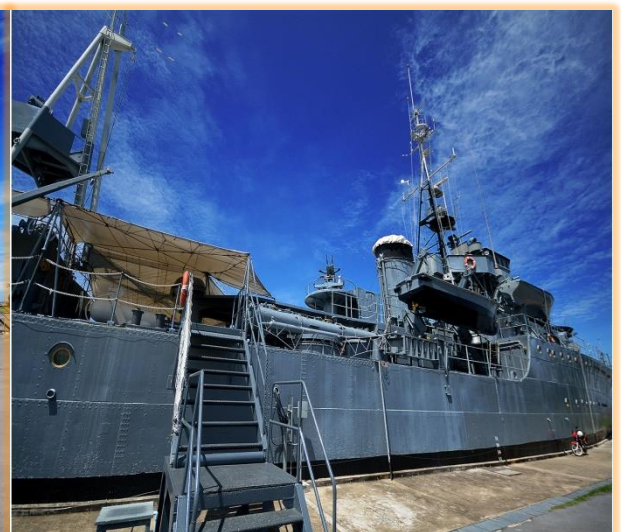
เรือหลวงแม่กลอง