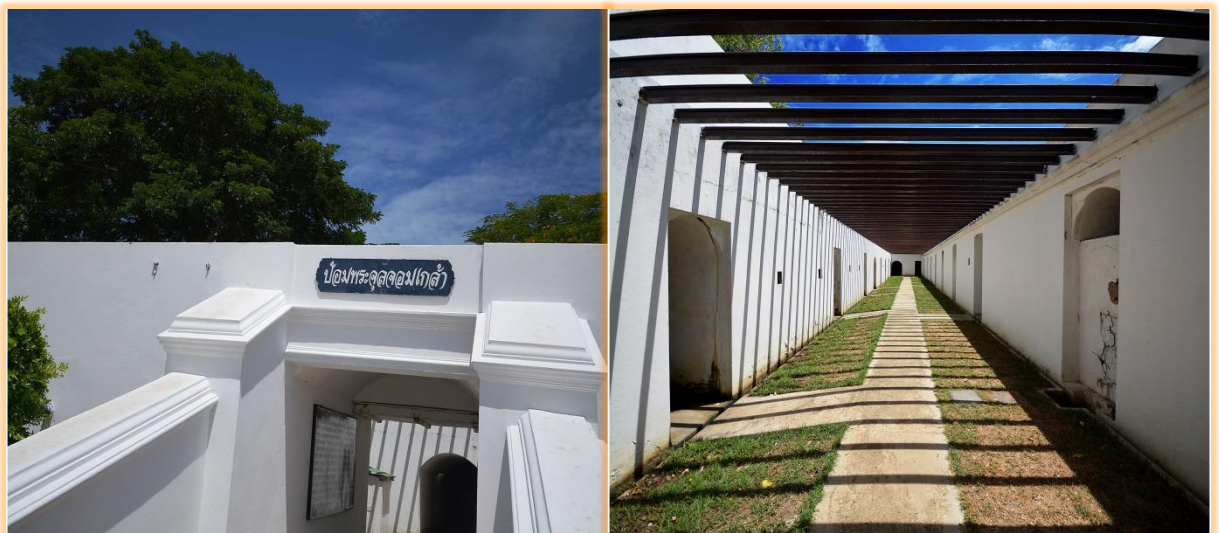
ภายในป้อมพระจุล