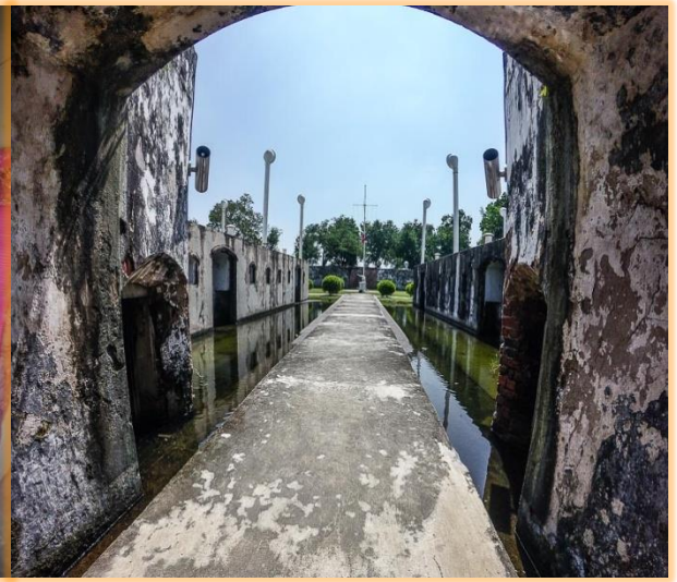
ประตูป้อมปืน