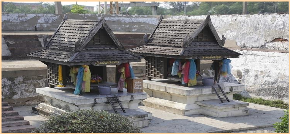
ศาลเจ้าแม่ผีเสื้อสมุทร