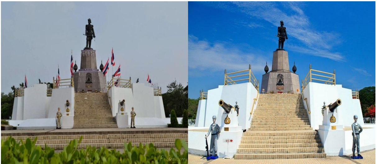
พระบรมราชานุสาวรีย์