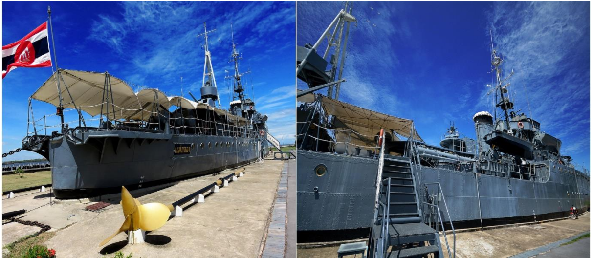
เรือหลวงแม่งลอง