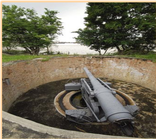
ปืนเสือหมอบ