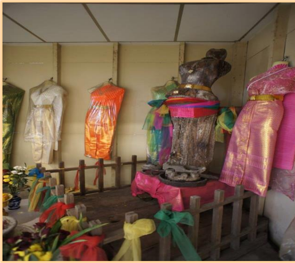
ศาลixonเรือเจ้าแม่ปาราวดี