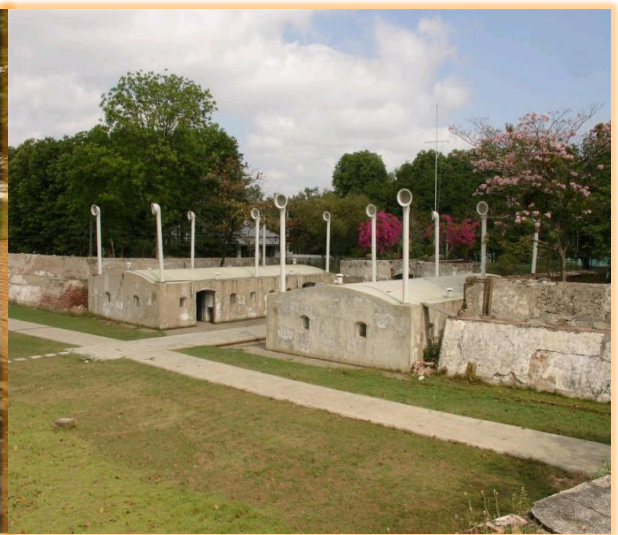
คลังท่นระเบิด