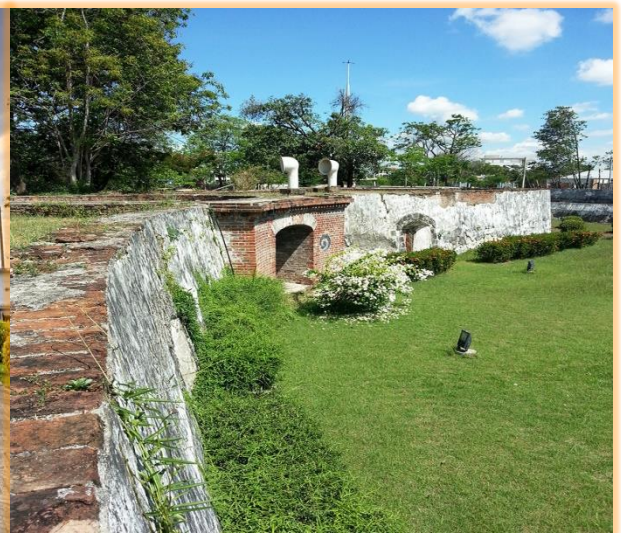
พิพิธภัณฑ์ป้อมผีเสื้อสมุทร