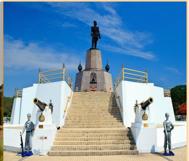
พระบรมราชานุสาวรีย์